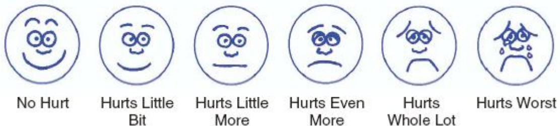
شکل (۱): موفقیت علامتی بیماری (Symptomatic score) به عنوان کاهش قابل ملاحظه درد تعیین شد.

یکی از روش‌های درمان کیست ساده کلیه، آسپیراسیون پر-کوتانئوس، با یا بدون تزریق مواد اسکروزان می‌باشد. در این روش ممکن است عود کیست داشته باشیم (۶) و نیز عوامل اسکروزان ممکن است موجب سپسیس و آنافیلاکسی شود (۷) و در مواردی نیز فیستول‌های شریانی- وریدی ایجاد می‌شوند، مواردی که تکنیک جراحی پرکوتانئوس ناموفق بوده، نهایتاً منجر به جراحی باز دکورتیکاسیون کیست کلیه شده‌اند. این روش‌ها با وجود مؤثر و بودن ممکن است همراه با عوارض قابل توجه در هنگام عمل و بعد از عمل و نیز بستری طولانی مدت در بیمارستان باشد (۸). اخیراً با ظهور لاپاراسکوپیک و گسترش استفاده از آن در ارولوژی، انجام لاپاراسکوپیک در کیست‌های علامت‌دار، بسیار مؤثر و همراه با کمترین عوارض، کاهش زمان جراحی، کاهش خونریزی و کاهش زمان بستری شده (۹) و به عنوان روش انتخابی جراحی به کار می‌رود (۱۰).