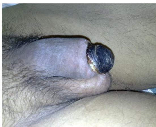
تصویر (۱): نکروز خشک و سیاه و تغییرات ایسکمیک گلانس

در بررسی سونوگرافی داپلر عروق اندام‌ها، کاهش شدید جریان خون در ناحیه مچ و انتهایی دست‌ها مشهود بود. بعد از مشاوره ارولوژی از طرف سرویس داخلی به علت نکروز پنیس، ابتدا سعی کردیم که بیمار را با دبریدمان‌های مکرر در جلسات مختلف درمان کنیم و لیکن وضعیت پیش رونده بود و باعث شد که رزکسیون وسیع‌تر به صورت پارشیل پنکتومی جهت بیمار صورت بگیرد. تمام گلانس، حدوداً ۱ سانتی متر از دیستال شفت پنیس و دیستال مجرا را تا بافت زنده برداشتیم، اجسام اسفنجی ترمیم شد و مجرا پس از اسپاچوله کردن به پوست آناستوموز زده شد و در نهایت یک مئاتوس جدید در دیستال و نترال پنیس ایجاد شد. دوره پس از عمل بدون عارضه بود و بیمار براحتی می‌توانست ادرار کند و پس از ۲ ماه نکروز یا ضایعه دیگری مشاهده نشد. در بررسی پاتولوژیک، نکروز بافت‌ها و فیبروز وسیع گلانس و کلسی فیکاسیون شریانچه‌ای در این بیمار برجسته بود و این شکل پاتولوژیک در اکثر مناطق برش بافتی دیده می‌شد (تصاویر ۴).