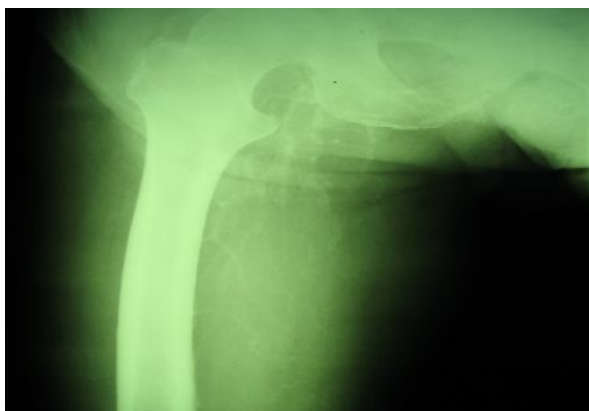
تصویر (۳): کلسیفیکاسیون منتشر عروقی در ران

در بررسی پاراکلینیکال بیمار هیپرکلسمی و هیپر فسفاتمی مشهود بود. (Ca= 10.2 و P= 8.9) افزایش PTH تا حدود ۱۶۳ Pg/ml نیز مشاهده می‌شد. بیمار مقادیر افزایش یافته AST و ALT و ALP را نیز داشت سایر آزمایشات پاراکلینیکال طبیعی بود. در بررسی تصویرنگاری ناحیه ران بیمار کلسیفیکاسیون منتشر عروقی مشهود بود (تصویر ۳).