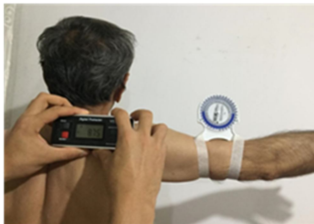
شکل (۱): تصویری از نحوه اندازه گیری چرخش بالایی کتف و ابداکشن ۹۰ درجه بازو در سطح فرونتال (۱۲)

ابداکشن بازو بر چرخش بالایی و نسبت ریتم اسکاپولوهومرال استفاده شد. همچنین از آزمون تی همبسته برای مقایسه متغیرهای مستقل بین دو دست استفاده شد. سطح معنی داری