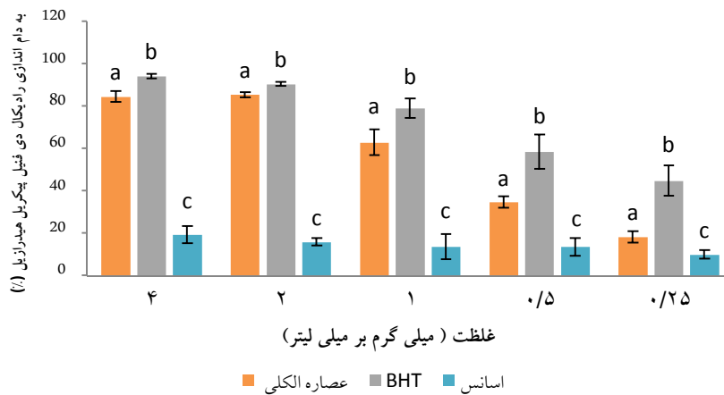
نمودار (۱): میزان به دام اندازی رادیکال DPPH غلظت‌های مختلف عصاره اتانولی و اسانس نعنای آبی در مقایسه با BHT

آنالیز آماری به روش دانکن، در هرستون حروف کوچک غیر مشابه نشان دهنده اختلاف معنی دار در سطح p \leq 0.05