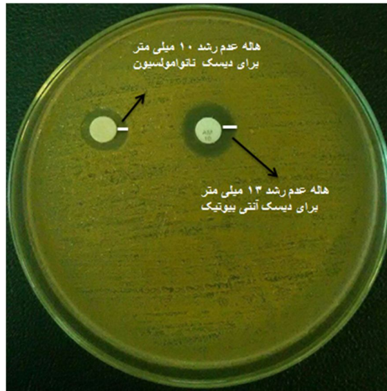
شکل (۱): فعالیت ضد میکروبی نانوامولسیون در مقایسه با آنتی بیوتیک آمپی سیلین با هاله عدم رشد به ترتیب ۱۰ و ۱۳ میلی متر که نشان دهنده اثرات بالای نانوامولسیون در مهار باکتری گرم مثبت استافیلوکوکوس اورئوس می باشد.

ضد میکروبی نانوامولسیون در مهار سویه استافیلوکوکوس اورئوس می باشد.