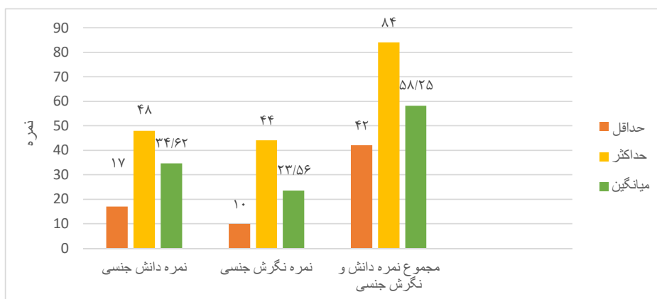
نمودار (۱): مقادیر نمرات دانش و نگرش جنسی دختران نوجوان مورد مطالعه