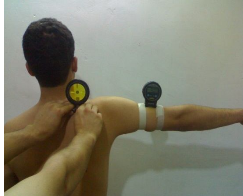
شکل (۱): روش اندازه‌گیری ریتم اسکاپولوهومرال در ۹۰ درجه ابداکشن شانه (۱۶)

روی لبه بالایی کتف (خار کتف) قرار گرفته بود، اندازه‌گیری می‌شد (۲۱). ریتم اسکاپولوهومرال توسط تقسیم کردن ابداکشن شانه بر چرخش بالایی کتف محاسبه می‌شد (۱۶). آزمودنی حرکت را در ابداکشن ۹۰، ۴۵ و ۱۳۵ درجه نگه‌داشته و مقدار عددی دو اینکلینومتر یادداشت و جهت محاسبه ریتم استفاده می‌شد. ریتم اسکاپولوهومرال از پوزیشن استراحت کتف تا ۴۵، ۴۵ تا ۹۰ و ۹۰ تا ۱۳۵ درجه ابداکشن شانه محاسبه می‌شد. آزمودنی هر حرکت را سه بار انجام می‌داد و میانگین سه حرکت جهت تجزیه و تحلیل استفاده می‌شد.