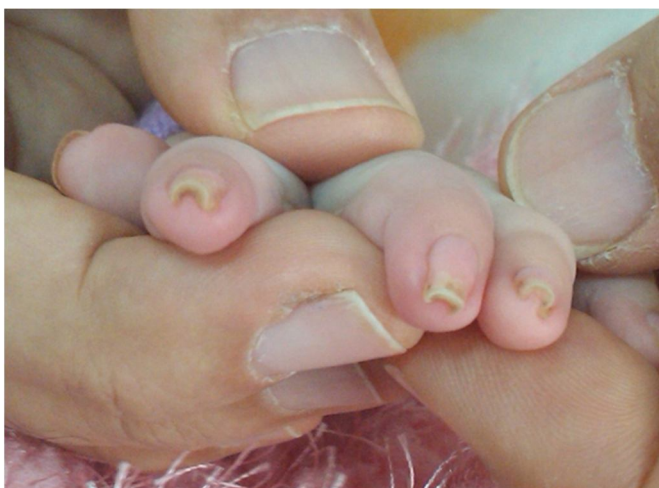
شکل (۱): تغییر شکل گازانبری در ناخن‌های دست

در اکوکاردیوگرافی‌های بعدی چهار ماه بعد از ترخیص بیمار، خوشبختانه آنوریسم در عروق کرونر بهبود یافته بود و به خاطر آن وارفارین قطع‌شده و فقط آسپیرین با دوز ضد انعقادی به بیمار داده شد. در مراجعات بعدی یک سال بعد از ترخیص، شیرخوار حال عمومی خوب را داشته و در بررسی‌های اکوکاردیوگرافیک آنوریسم در عروق کرونر کاملاً بهبود یافته بود.