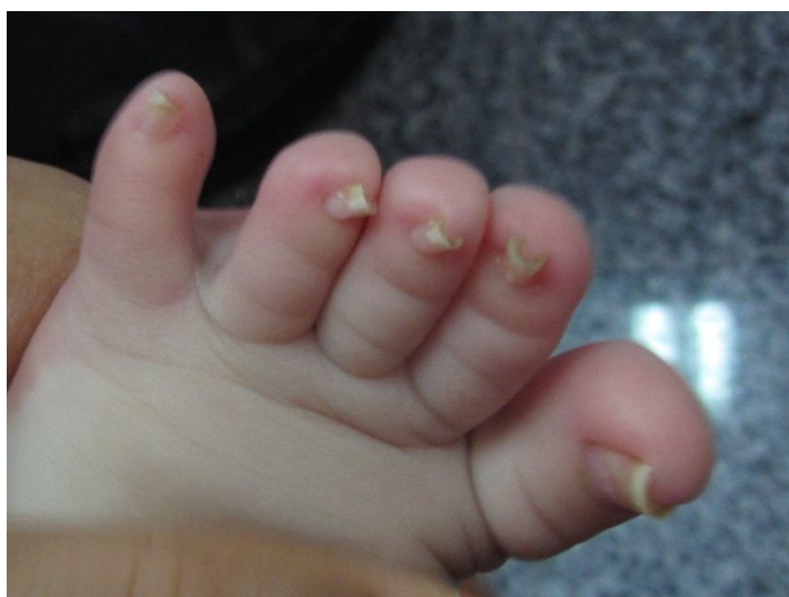
شکل (۳): تغییر شکل گازانبری به‌طور منتشر در ناخن‌های پا