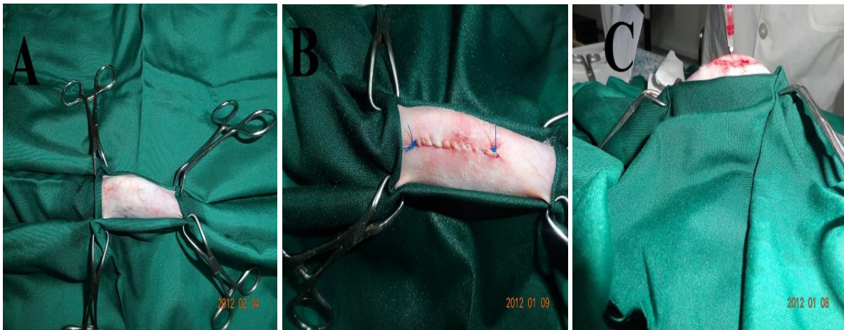
تصویر A: مربوط به نحوه آماده سازی زانو برای جراحی، تصویر B: مربوط به نحوه بخیه گذاری بعد از جراحی و تصویر C: مربوط به نحوه تزریق PRP در زانوی خرگوش