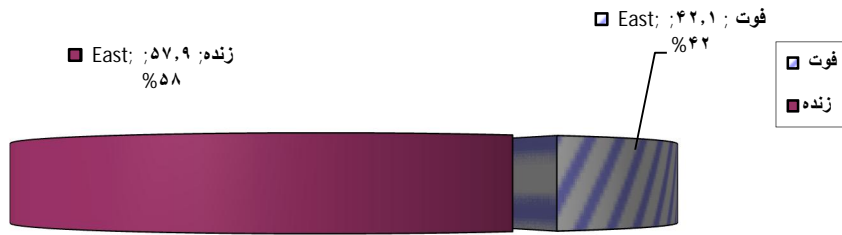
نمودار شماره (۳): توزیع فراوانی نسبی میزان مرگ و میر در جمعیت مورد مطالعه