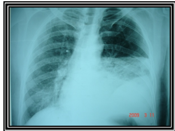
تصویر شماره (۱): هیدروپنوموتوراکس

شدت بی‌حال و دهیدراته بود. علائم حیاتی بیمار به ترتیب زیر بود: P.R:110/min, R.R:24/min Axillary Temp.38/5. در آزمایش خون لوکوسیتوز و انحراف به چپ شدید داشتند (۲۳۰۰۰) در هر سانتی مترمکعب و ۹۳ درصد نوتروفیل. در مرور شرح حال بیمار پرخوری و مصرف مواد مخدر را ۲ ساعت قبل از شروع علائم ذکر کردند. با توجه به شرح حال و یافته‌های گرافی سینه برای بیمار لوله سینه تعبیه شد که حدود ۵۰۰ سی سی مایع کدرو خارج شد. پارگی مری و پانکراتیت به عنوان تشخیص اول مطرح شدند. که با توجه به فاصله کم بین شروع علائم و افیوژن نسبتاً زیاد محتمل‌ترین تشخیص پارگی مری بود. مطالعه با ماده حاجب انجام شد که با نشان دادن نشت ماده حاجب تشخیص را اثبات کرد (تصویر ۲).