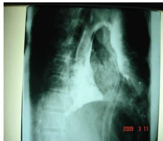
تصویر (۲): نشت ماده کنتراست

بیمار آماده عمل شد و تحت توراکوتومی پوسترولترال چپ قرار گرفت. حدود ۲ لیتر چرک و مواد غذایی از قفسه سینه خارج شد. بعد از خارج کردن ترشحات بررسی‌ها نشان دهنده پارگی ۶-۵ سانتی‌متری در دیستال مری بود تصویر شماره (۳).