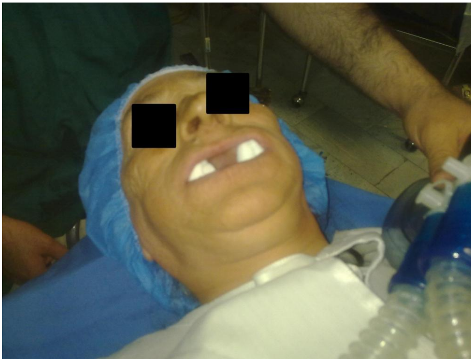
تصویر شماره ۱