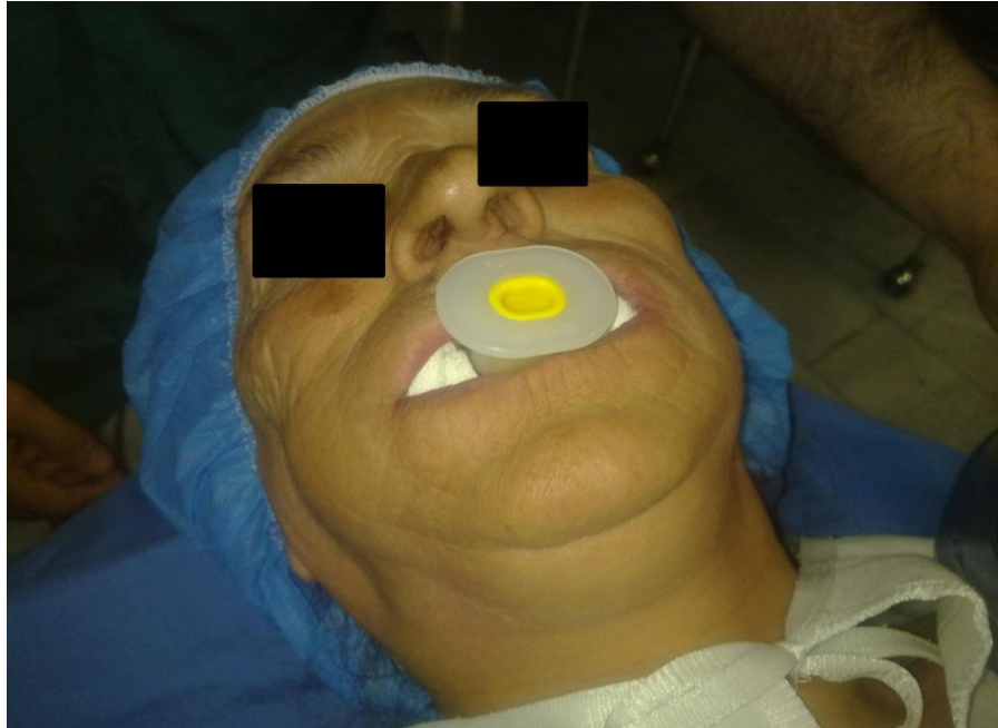
تصویر شماره ۲