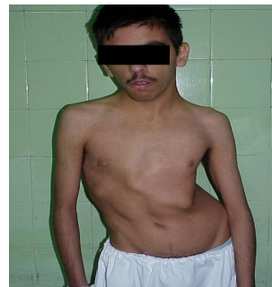
عکس ۱: نمای روبروی قبل از عمل پسر ۱۸ ساله با اسکولیوز ایدیوپاتیک

برای اطلاع از اختلالات عصبی احتمالی از تست wake up استفاده شده جهت اجرای این تست از نوعی روش بی هوشی استفاده می شود که در آن بیمار حین عمل هوشیار بوده ولی احساس درد نمی کند. با آموزش قبل از عمل به بیمار ما از او می خواهیم انگشتان پای خود را حرکت دهد. در صورت اطاعت از دستورات، تست مثبت تلقی شده و نشانه عدم کشش نخاع می باشد. بعد از عمل از وسایل بی حرکت کننده خارجی استفاده نشد. بیماران