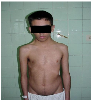
عکس ۲: نمای روبروی بعد از عمل

قد ایستاده و نشسته بیماران در مقایسه با قبل از عمل ۵ سانتی متر (حداقل ۳ و حداکثر ۱۰ سانتی متر) افزایش یافته بود که در طول مدت کنترل بعد از عمل کاهش نداشت.