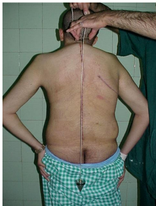
عکس ۲: نمای خلفی بعد از عمل