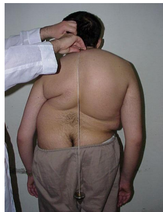
عکس ۱: نمای خلفی قبل از عمل