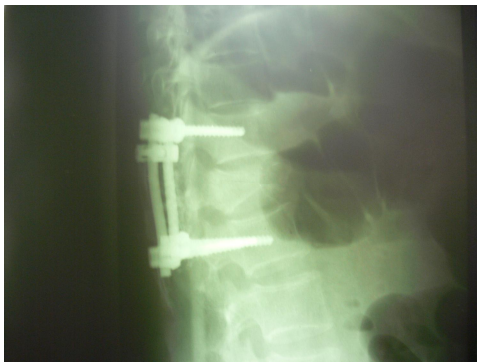
شکل شماره (۲)