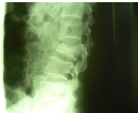
شکل شماره (۱)

در مرحله دوم با اصلاح مسیر و تعیین محل ورود پیچ‌ها، فقط ۱۰ پیچ (۱۵/۵٪) جاگذاری مناسب نداشتند که از این ۱۰ پیچ، ۴ پیچ در مهره L 2 از 6/5 \times 4.0^\circ به 6/5 \times 4.5^\circ و در مهره T 11 ۶ پیچ از 4/5 \times 4.0^\circ به 5/5 \times 4.5^\circ تبدیل و اصلاح مسیر داده شده است (۶ عدد در سمت چپ و ۴ عدد در سمت راست بوده است) در حین عمل جراحی هیچ‌گونه عارضه‌ای از قبیل پارگی دورمر، لیک csf و خون‌ریزی وسیع وجود نداشته در فالوآپ ۶ ماه تا ۳ سال بیماران از پیچ‌های گذاشته شده ۳ مورد وضع نسبتاً مناسب نداشتند (۱/۶٪) و فقط یک مورد عفونت سطحی در محل انسزیون وجود داشته و عارضه دیگری وجود نداشته است.