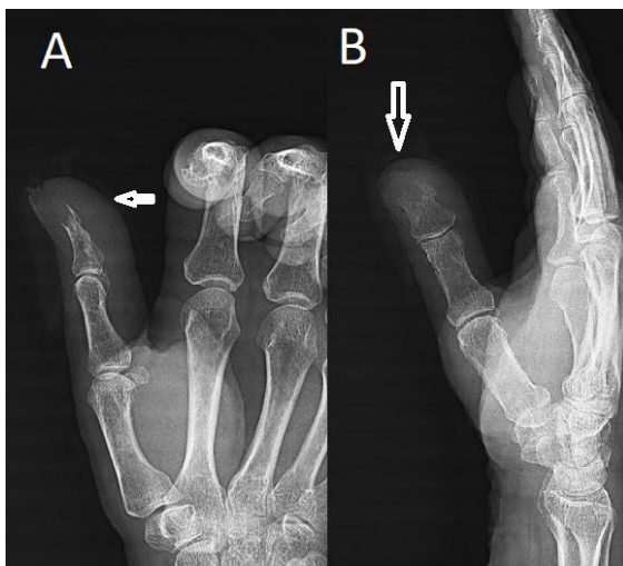
تصویر (۱): رادیوگرافی ساده در دو نمای رخ A ونیم رخ B انگشت شصت دست راست. یک ضایعه لیتیک و با تخریب قشر استخوان دیستال انگشت شصت را به همراه تورم بافت نرم نشان می دهد. (پیکان های سفید، در تصویر A, B)

لیتیک استخوانی را در دیستال فالانکس انگشت نشان می داد (تصویر ۱).